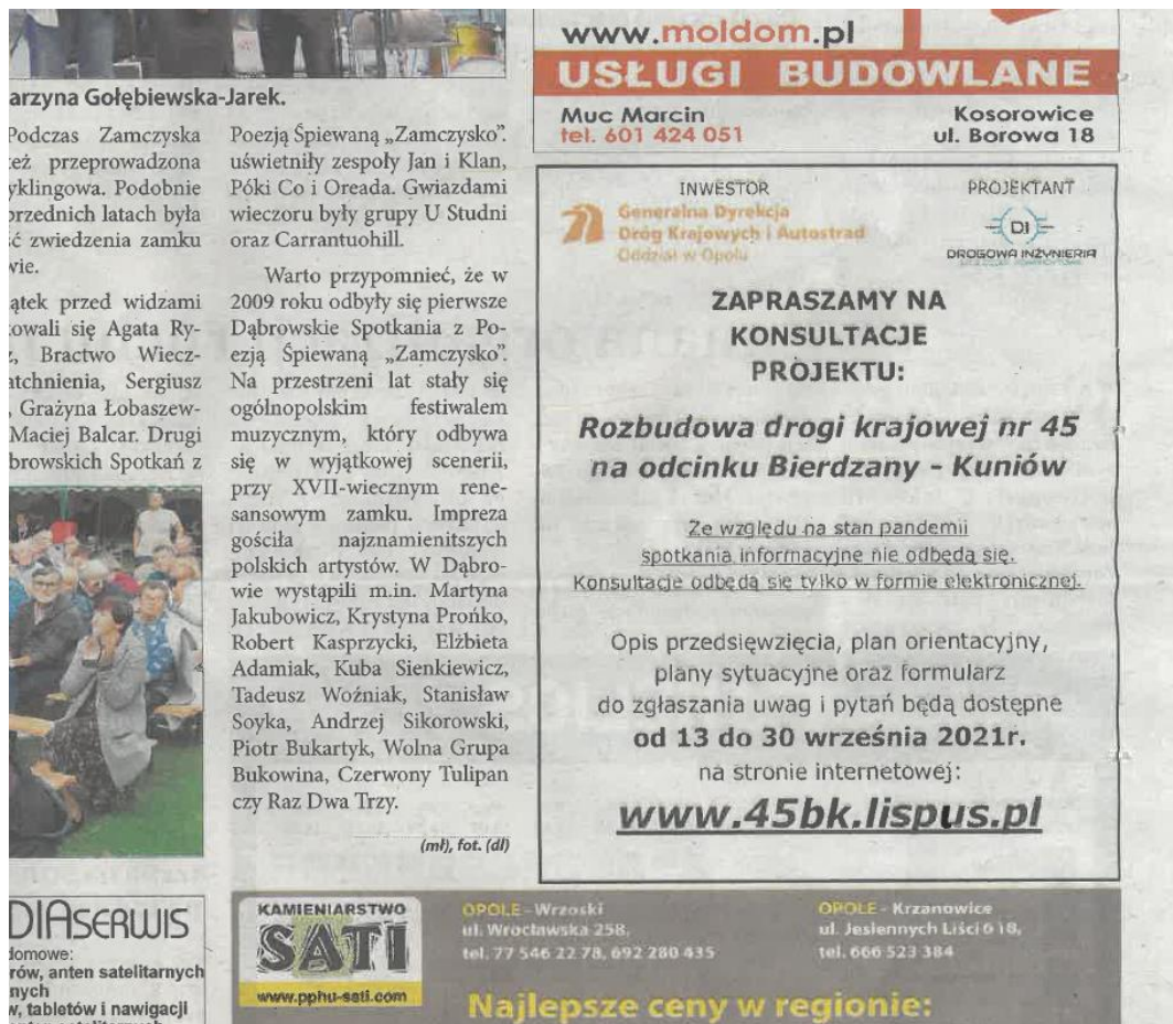
Rysunek 2 Ogłoszenie w prasie „Tygodnik Ziemi Opolskiej”