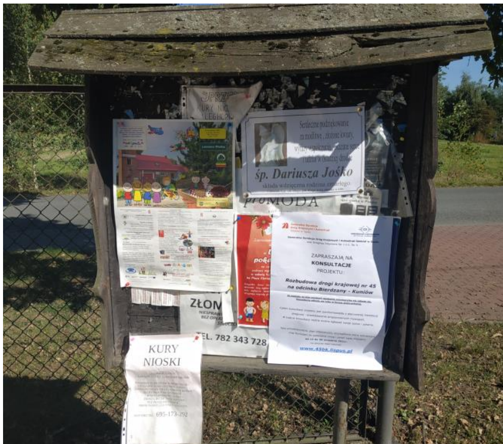
Rysunek 3 Ogłoszenie na tablicy ogłoszeniowej w gminie Lasowice Wielkie