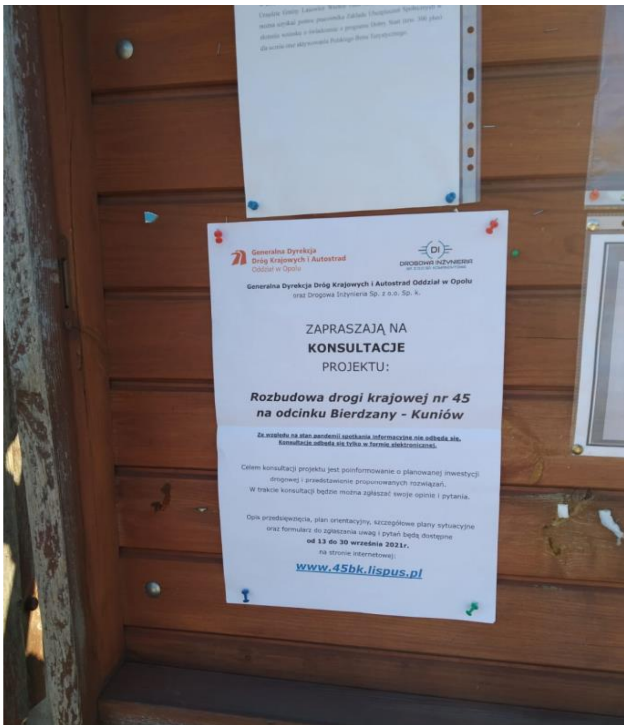
Rysunek 6 Ogłoszenie na tablicy ogłoszeniowej w gminie Lasowice Wielkie