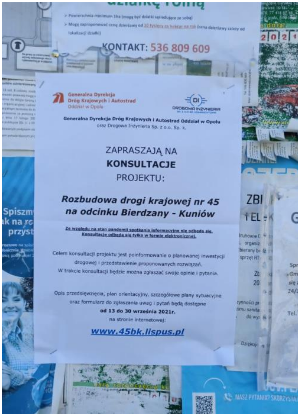
Rysunek 5 Ogłoszenie na tablicy ogłoszeniowej w gminie Lasowice Wielkie